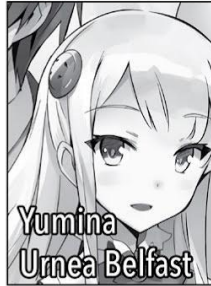
Yumina Urnea Belfast

One of Touya's wives. The elder of the twin sisters saved by Touya some time ago. A ferocious melee fighter, she makes use of gauntlets in combat. Her personality is fairly to-the-point and blunt. She can make use of Null fortification magic, specifically the spell [Boost] . She loves spicy foods.