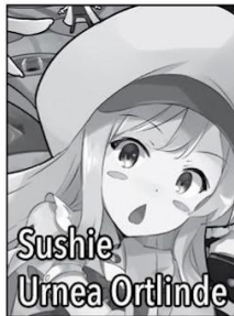
Sushie Urnea Ortlinde

A highschooler who was accidentally murdered by God. He's a no-hassle kind of guy who likes to go with the flow. He's not very good at reading the atmosphere, and typically makes rash decisions that bite him in the ass. His mana pool is limitless, he can flawlessly make use of every magical element, and he can cast any Null spell that he wants. He's currently the Grand Duke of Brunhild.