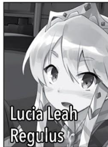
Lucia Leah Regulus

One of Touya's wives. She was ten years old in her initial appearance. Her nickname is Sue. The niece of Belfast's king, and Yumina's cousin. Touya saved her from being attacked on the road. She has an innocently adventurous spirit.