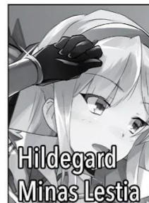
Hildegard Minas Lestia

One of Touya's wives. Former Clan Matriarch of the Fairies, she now serves as Brunhild's Court Magician. She claims to be six-hundred-and-twelve years old, but looks tremendously young. She can wield every magical element except Darkness, meaning her magical proficiency is that of a genius. Leen is a bit of a light-hearted bully.